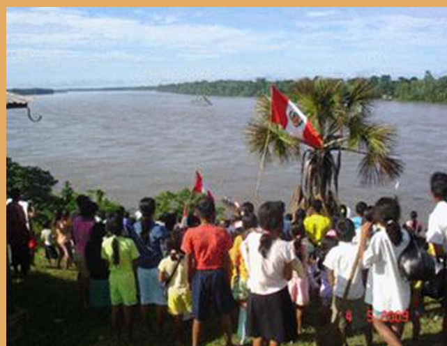
Indígenas Kichwas de Copal Urco en el río Napo en protesta por la presencia de la Marina de Guerra del Perú protegiendo las embarcaciones de la empresa petrolera Perenco — mayo 2009.

De aprobarse este proyecto de ley, podría generar más conflictos sociales, si estas medidas no cuentan con el consentimiento de la población afectada.